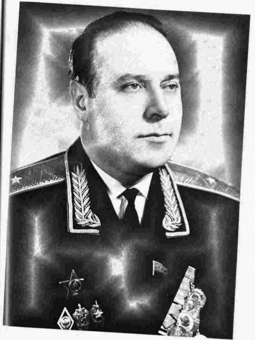
...DTK general-mayoruna qadar.