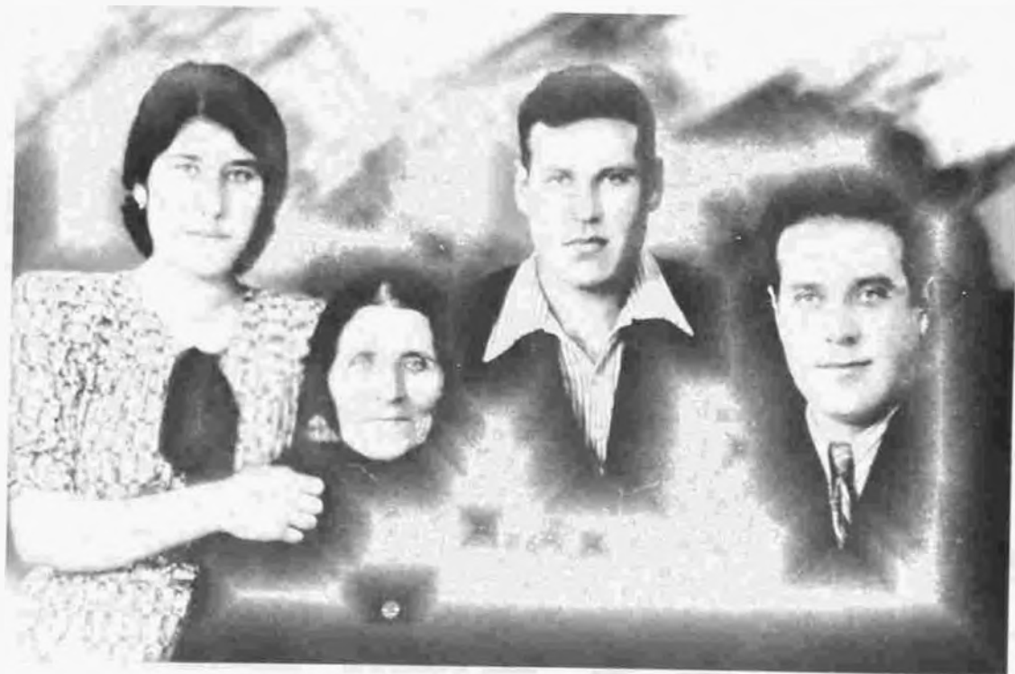
Heydər Əliyev anası, qardaşı və bacısı Rəfiqə ilə.