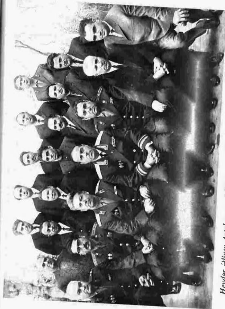
Heydər Əliyev Azərbaycan DTK-sının rəhbər heyəti ilə. 20 dekabr 1967-ci il.