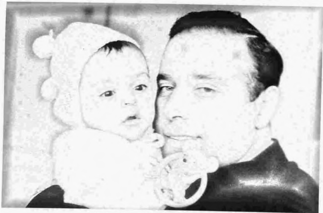
1955-ci ildə H.Əliyev xoşbəxt ata oldu.