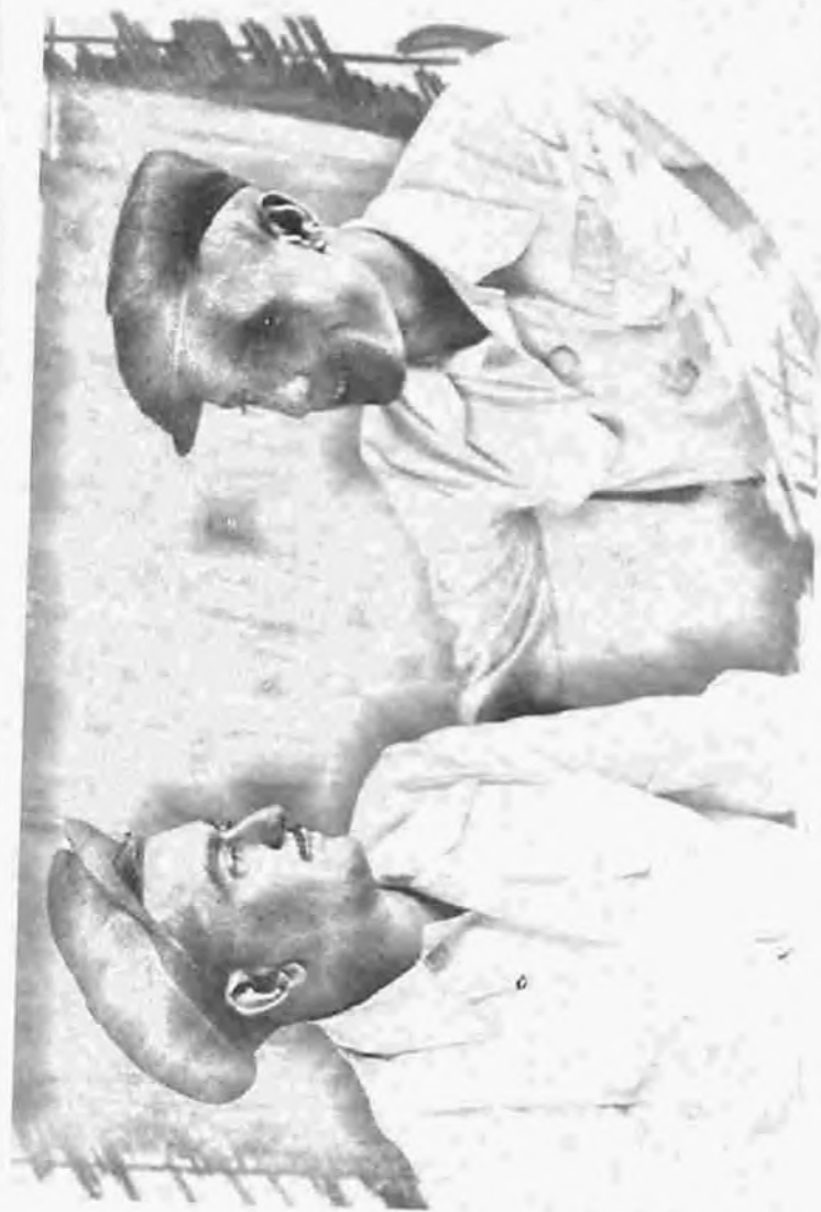
H. Əliyev və İ. İsmayılov 1945-ci ildə.