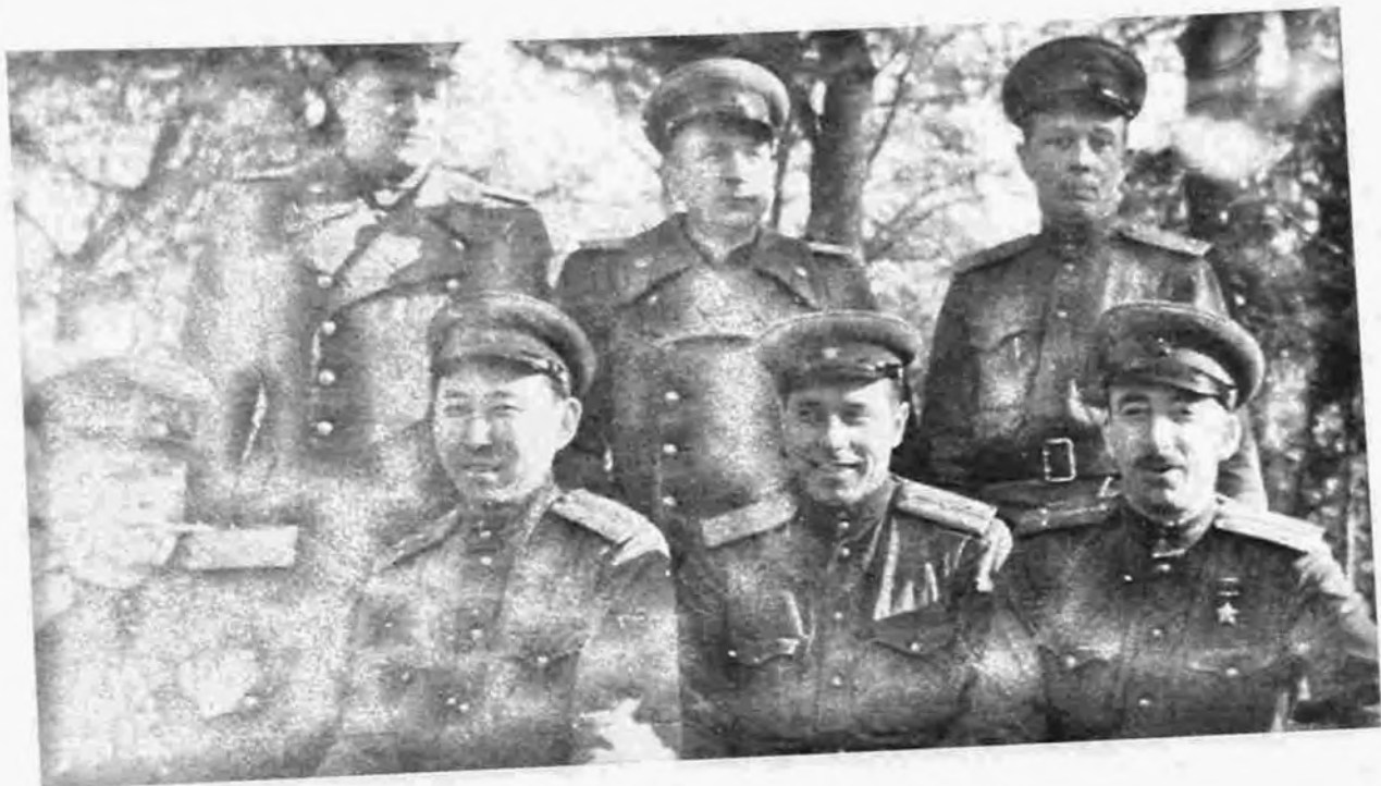
Leninqradda SSRİ DTN məktəbi. 1950-ci il.