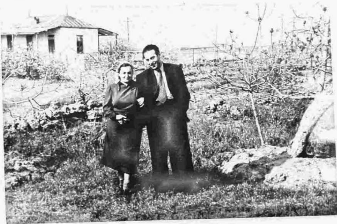
Gənc ailə. Zərifə və Heydər Əliyevlər.