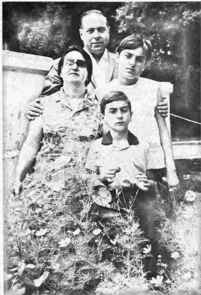
Zərifə və Heydər Əliyevlər uşaqları ilə.