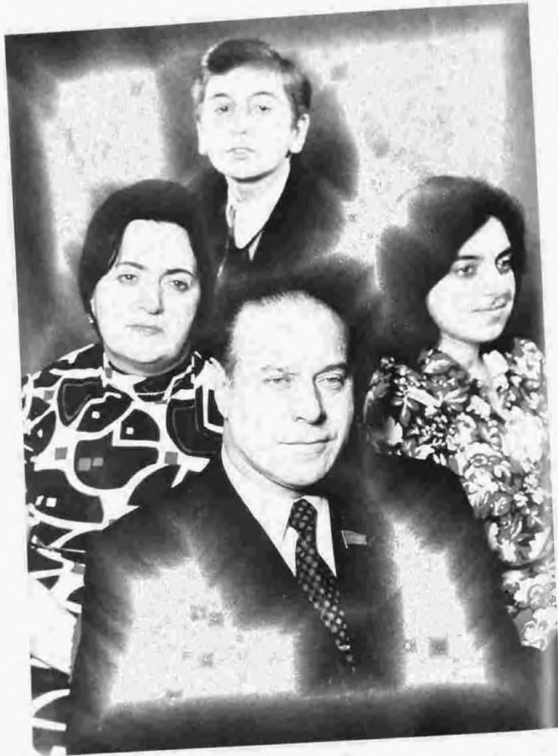
Uşaqlar necə də tez böyüdü...